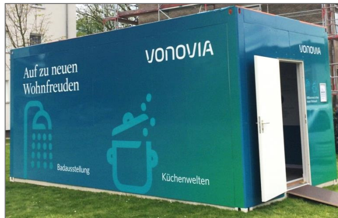
Bad- und Küchenausstellung